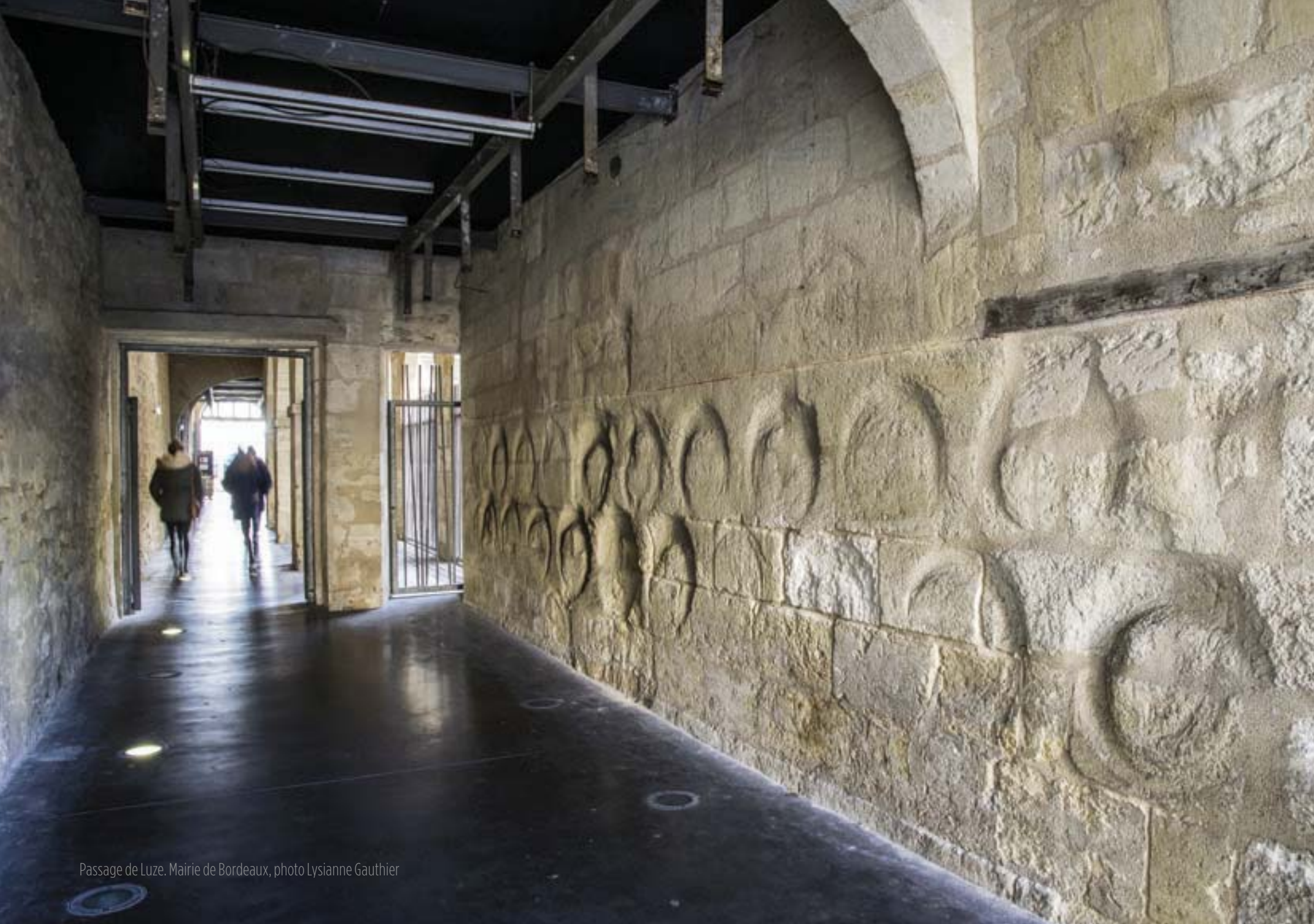
Passage de Luze. Mairie de Bordeaux, photo Lysianne Gauthier