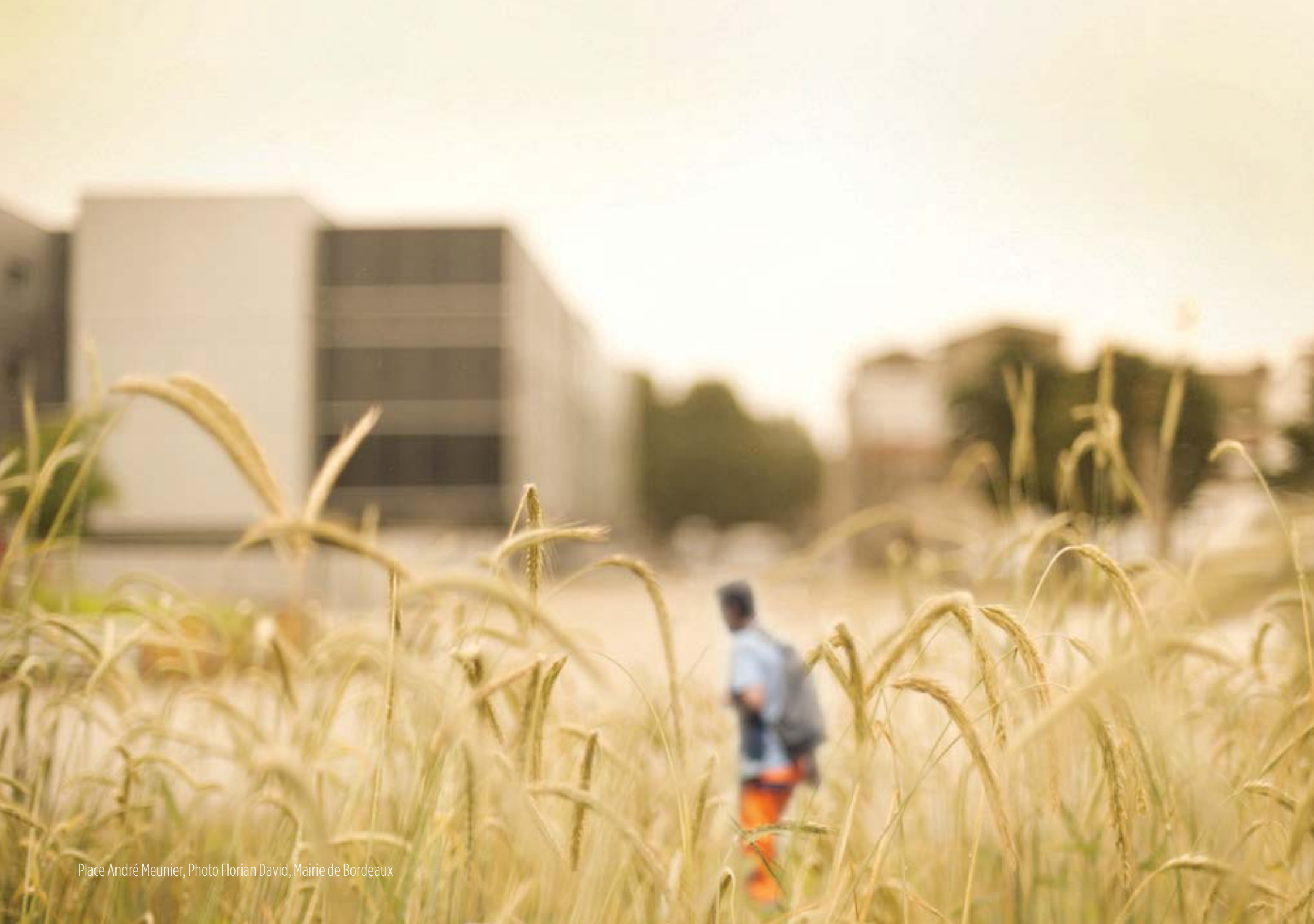
Place André Meunier